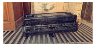
A gauche : ouvrier ostréicole prenant en photographie ce qui pour lui représente l'avenir de son métier. Ici, un casier australien équipé de flotteurs. A droite : la photographie qu'il a prise.