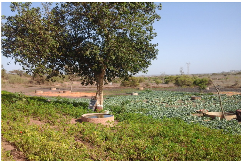
Zone des Niayes au Sénégal

des ressources (droit positif, coutumier, règles administratives), et (iii) la capacité d'action des acteurs face aux règles (leur « agencité »), qui se traduit par une distance entre règles et pratiques.